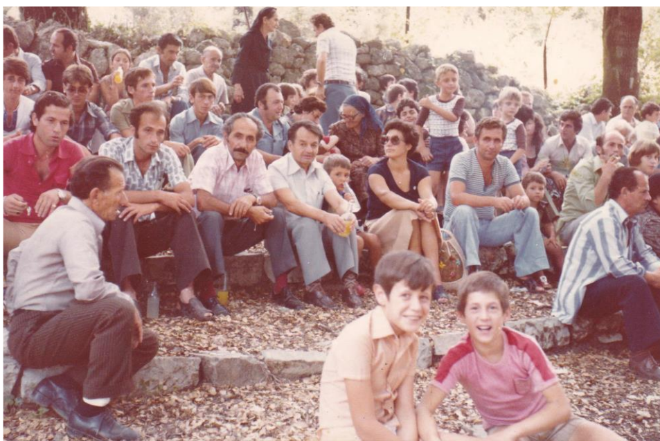
Πανηγύρι της Άγιας Σωτήρας στο Πάνω Καρώτι Φωτ. ( 4) Αρχείο Θωμά Ζήκα

ότι οι λίρες που έριζαν στο χορό ήταν περισσότερες, από τις λίρες, που έλεγαν τα όργανα.