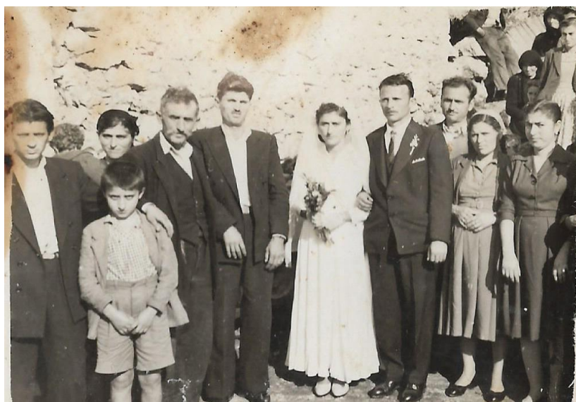
Καρνωτίτικος γάμος στο Πάνω Καρνώτι Φωτ. (3). Αρχείο Κωνσταντίνου Βασιλείου Σιώχου