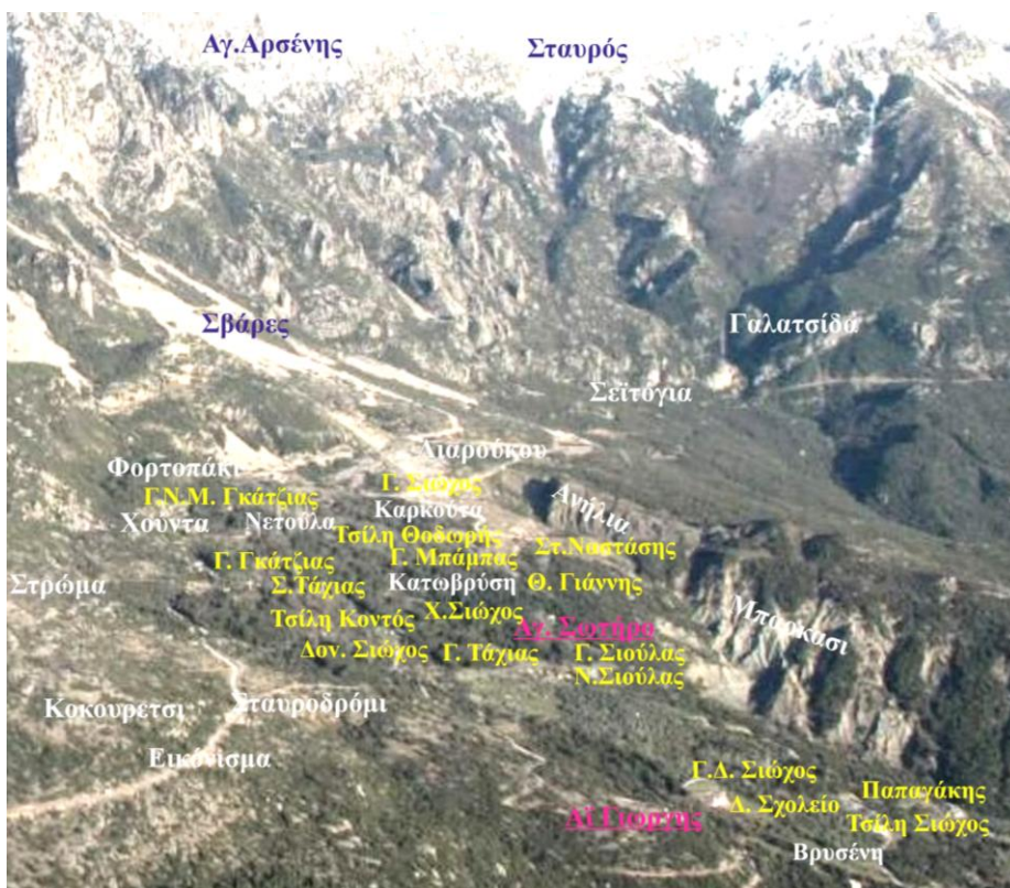
Το Πάνω Καρυώτι στη δεκαετία του 1950 Φωτ. (1) Αρχείο Κωνσταντίνου Γεωργίου Τάγια