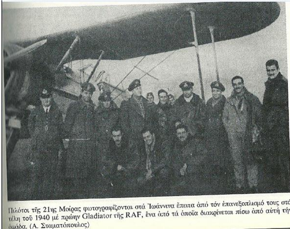
Πιλότοι της 21ης Μοίρας φωτογραφίζονται στα Ιωάννινα έπειτα από τον επανεξοπλισμό τους στα τέλη του 1940 με πρώην Gladiator της RAF, ένα από τα οποία διακρίνεται πίσω από αυτή την ομάδα. (Α. Σταματόπουλος)