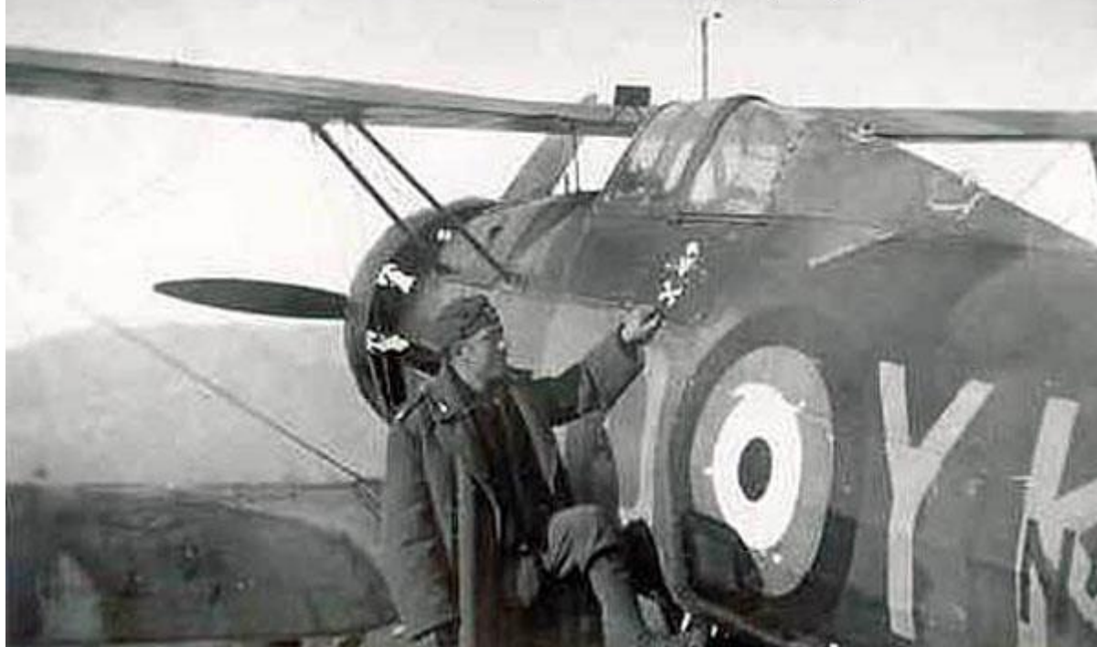
Gloster Gladiator MK 2 (καταδιωκτικό) στην Παραρμυθία

Η εργασία που σας παρουσιάζουμε είναι απο το βιβλίο: Ο ΑΕΡΟΠΟΡΙΚΩΣ ΠΟΛΕΜΟΣ ΣΤΗΝ ΕΛΛΑΔΑ 1940-1941, Από την Ήπειρο και την Μακεδονία έως την Μάχη της Κρήτης.