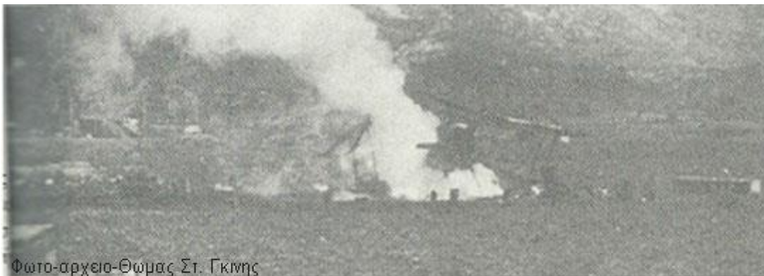
Φωτο-αρχείο-Θώμας Στ. Γκινης

Bf 109E Gladiator της 80ης Μοίρας που καταστράφηκε κατά την διάρκεια ενός Ιταλικού εφόδου στην Παραμυθιά στις 22 Μαρτίου 1941. (Ε. Μπέδινγκτον-Σμίθ)