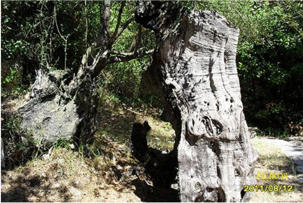
Η ιερή ελιά στον Άη Γιάννη ξαναφύτρωσε.