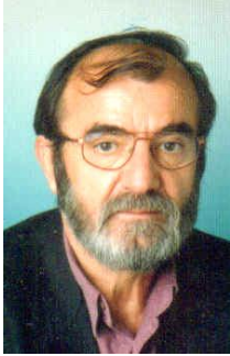
(γράφει ο Μάριος Α. Μπίκας)