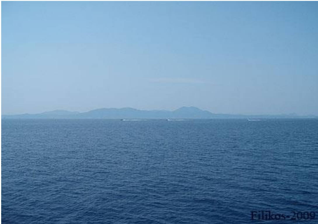
Άποψη από το Λιβαδάρι