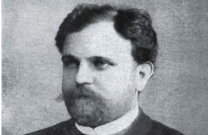
Ο Λορέντζος Μαβίλης (1860-1912)