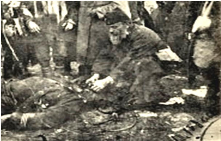
Ο παπα- Φώτης κλείνει τα μάτια του νεκρού Λορέντζου Μαβίλη. (Φωτό : Palmografos. Com. Ο ποιητής Λορέντζος Μαβίλης ...)

(Από τη μεγάλη σχολική ανθολογία του Ευάγγελου Πεντέα, σελ.57)