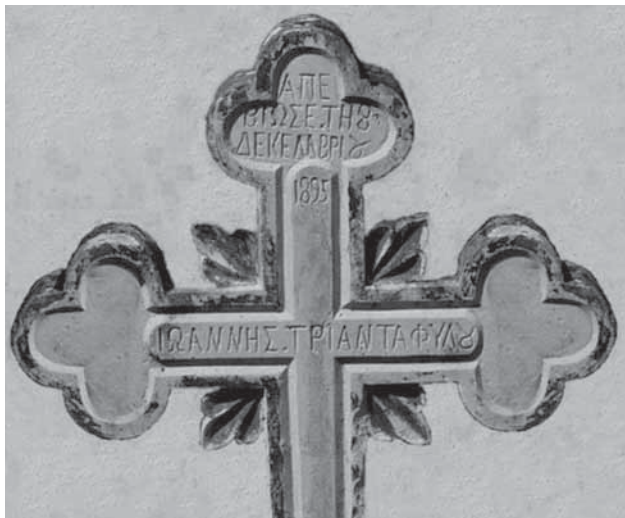
Ο επιτύμβιος σταυρός με το ανάγλυφο επίγραμμα: