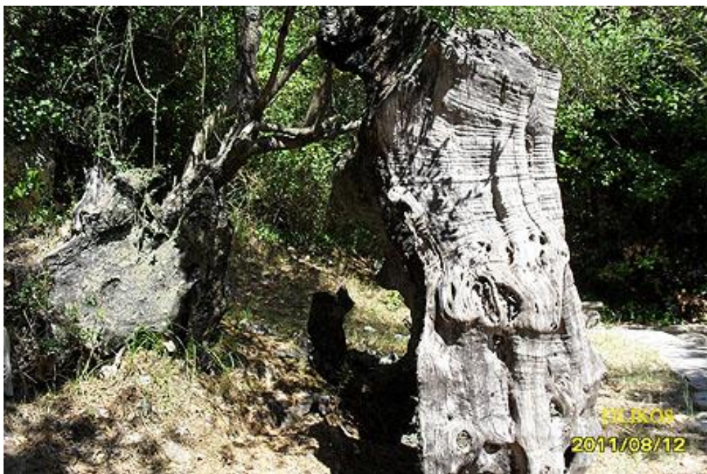
Η ιερή ελιά στον Άη Γιάννη ξαναφύτρωσε.