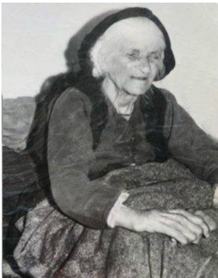
Η Βάβω Σιώχω Φωτό (1) Αρχείο παπα – Σωτήρη (Σταύρου)