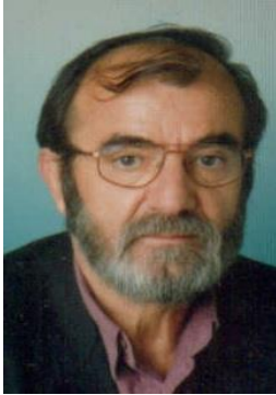
(Γράφει ο Μάριος Α. Μπίκας)